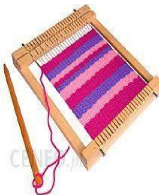
Krosno z „allegro”