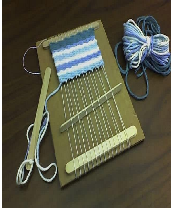
Krosna z tektury