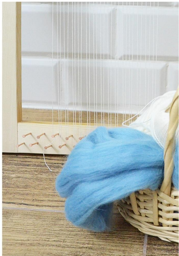
Krosno z ramki z gwoździami