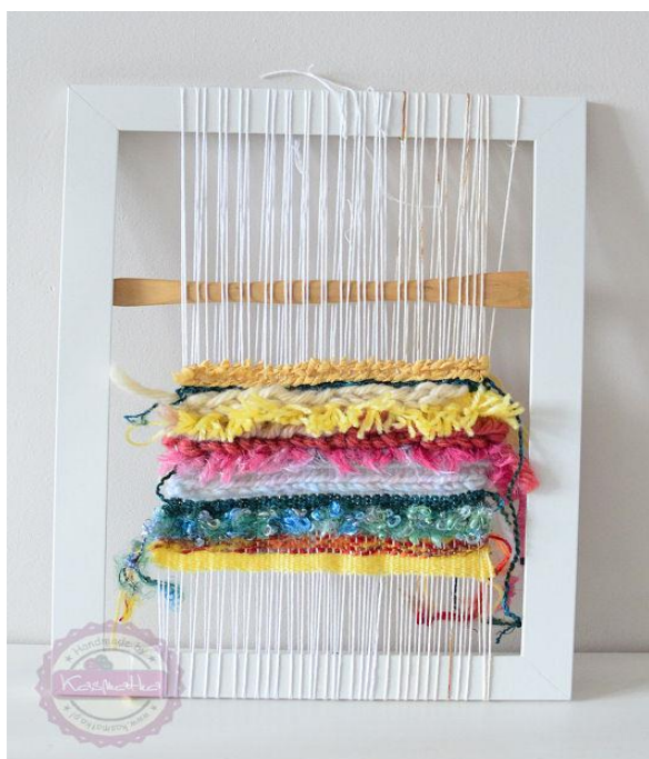
Krosno wykonane z ramki na zdjęcia