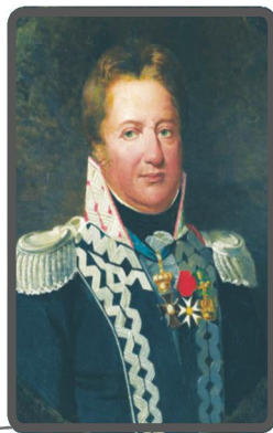
Muzeum Narodowe w Warszawie