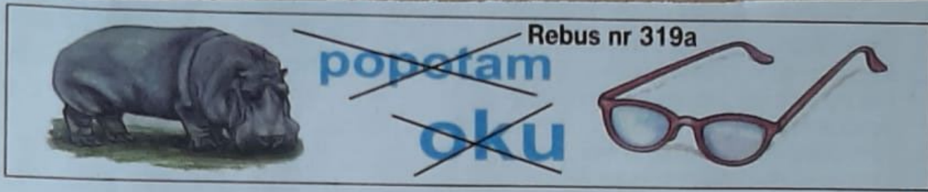
Rebus nr 319a