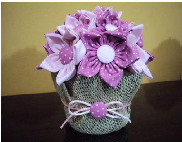
I tu jeszcze jedna