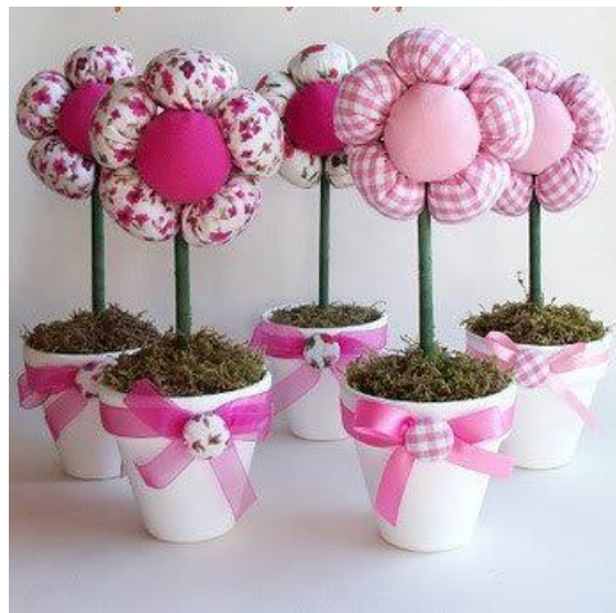
kwiatki w doniczkach