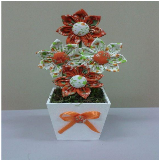
komozycja w donicze