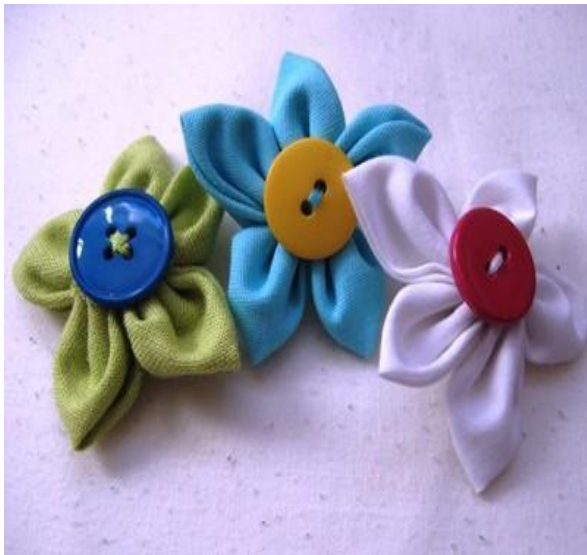
Kwiatki do naszyca