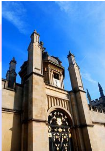
Katedra oraz uniwersytet