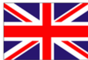
Current Union Flag (1801)