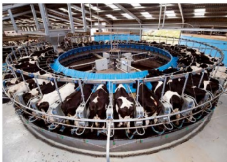
▲ Duńskie gospodarstwa, w których hoduje się bydło, są duże i zautomatyzowane.

Sporą część produkcji zbóż przeznaczają się na paszę dla zwierząt. Istotne znaczenie ma bowiem hodowla bydła (krów)