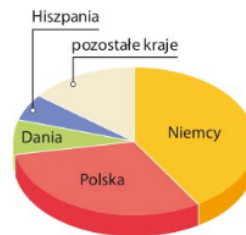
▲ Najwięksi producenci żyta w Unii Europejskiej w 2016 r.

? Odczytaj z poniższego wykresu przybliżoną wartość produkcji mięsa wieprzowego w Danii i w Polsce.